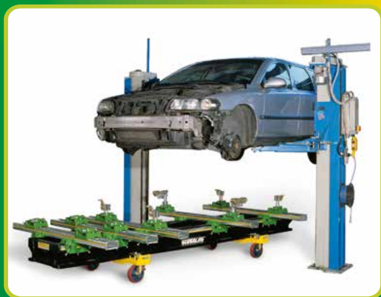
POSIZIONAMENTO VETTURA CON SOLLEVATORE A DUE COLONNE